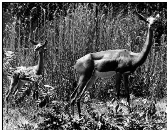
Fig. 4. Femmina con piccolo di antilope giraffa Litocranius walleri nata allo Zoo di Napoli, 1971.

Grazie anche alla creazione di una Stazione di Quarantena presso il Parco del Fusaro, il Giardino Zoologico di