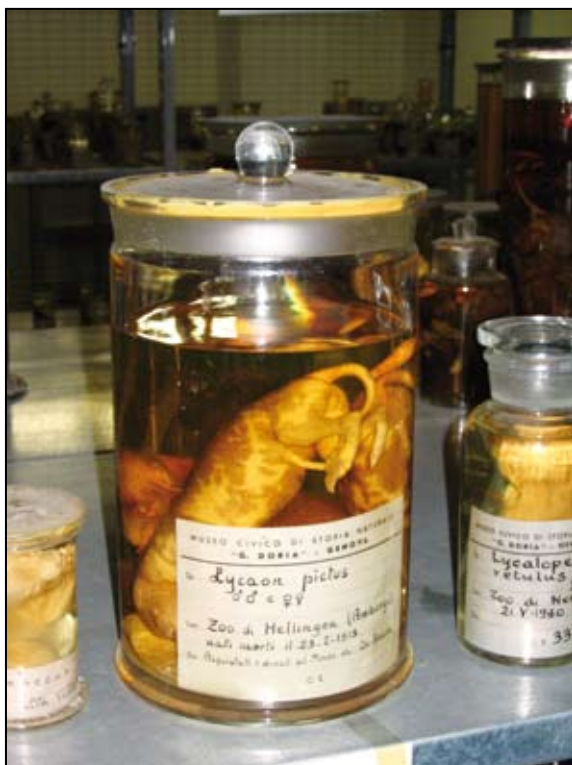
Fig. 3. Cuccioli di licaone Lycan pictus provenienti dal Parco Zoologico di Stellingen (Amburgo), conservati presso il Museo Civico di Storia Naturale "G. Doria" di Genova.